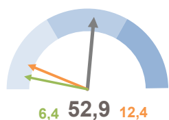
INCIDENZA SUPERFICIE CENTRI E NUCLEI