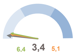
INCIDENZA SUPERFICIE CENTRI E NUCLEI