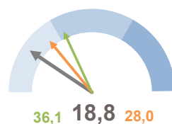
TASSO DI OCCUPAZIONE FEMMINILE