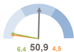
INCIDENZA SUPERFICIE CENTRI E NUCLEI