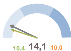
INCIDENZA POPOLAZIONE 75 ANNI E PIÙ