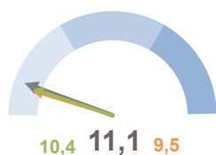
INCIDENZA POPOLAZIONE 75 ANNI E PIÙ