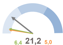
INCIDENZA SUPERFICIE CENTRI E NUCLEI