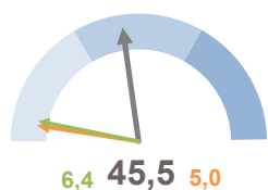
INCIDENZA SUPERFICIE CENTRI E NUCLEI