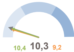
INCIDENZA POPOLAZIONE 75 ANNI E PIÙ