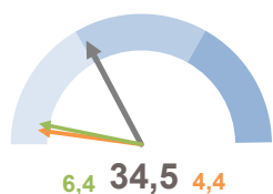
INCIDENZA SUPERFICIE CENTRI E NUCLEI