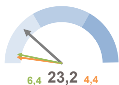
INCIDENZA SUPERFICIE CENTRI E NUCLEI