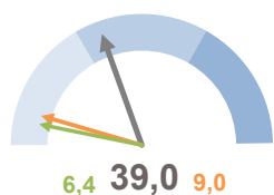
INCIDENZA SUPERFICIE CENTRI E NUCLEI