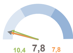
INCIDENZA POPOLAZIONE 75 ANNI E PIÙ