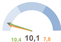
INCIDENZA POPOLAZIONE 75 ANNI E PIÙ