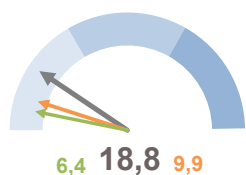
INCIDENZA SUPERFICIE CENTRI E NUCLEI