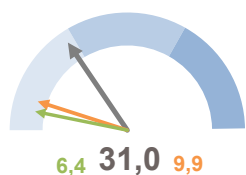
INCIDENZA SUPERFICIE CENTRI E NUCLEI