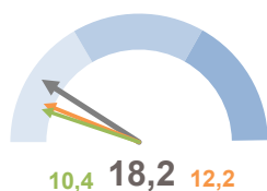
INCIDENZA POPOLAZIONE 75 ANNI E PIÙ