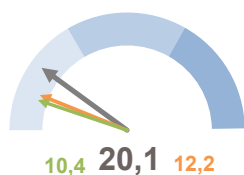
INCIDENZA POPOLAZIONE 75 ANNI E PIÙ