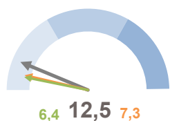
INCIDENZA SUPERFICIE CENTRI E NUCLEI