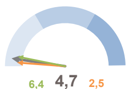
INCIDENZA SUPERFICIE CENTRI E NUCLEI