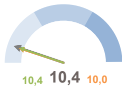
INCIDENZA POPOLAZIONE 75 ANNI E PIÙ