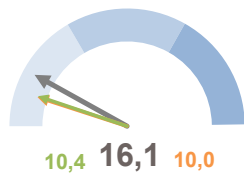
INCIDENZA POPOLAZIONE 75 ANNI E PIÙ