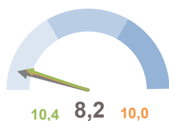
INCIDENZA POPOLAZIONE 75 ANNI E PIÙ