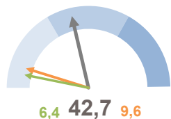
INCIDENZA SUPERFICIE CENTRI E NUCLEI