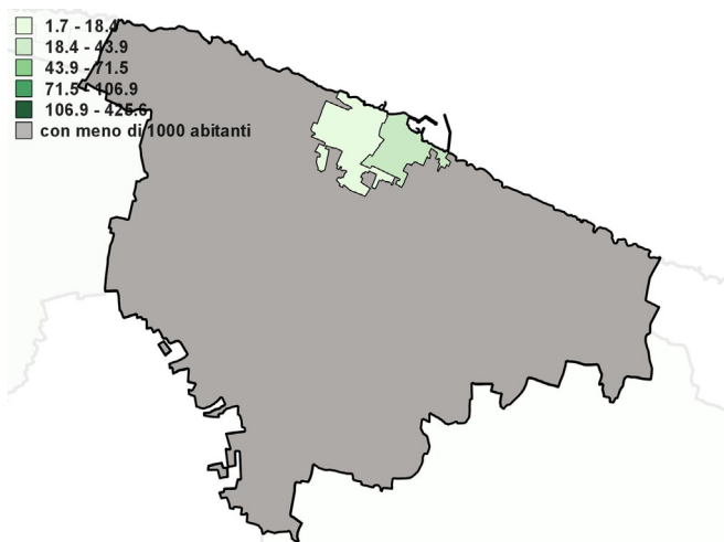
Incidenza di residenti stranieri