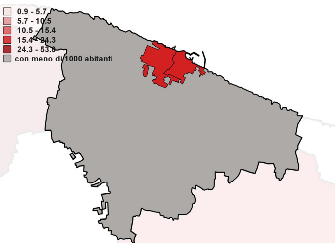
Mobilità fuori comune per studio o lavoro