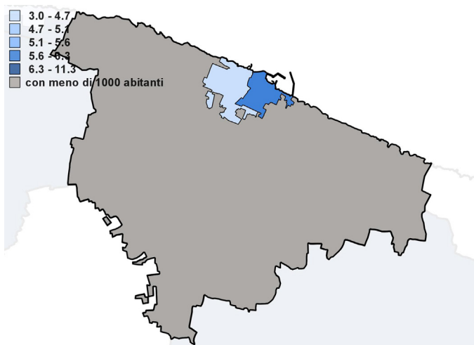
Incidenza della popolazione con meno di 6 anni